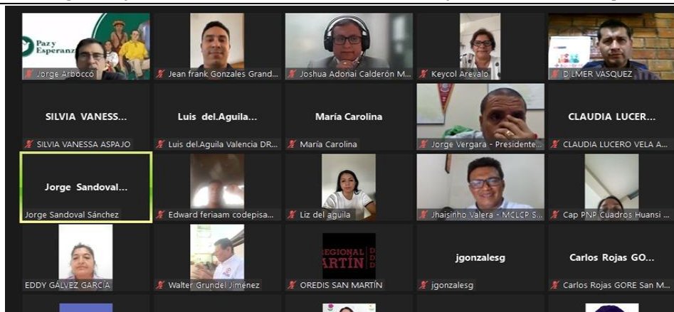
- Captura de pantalla de la participación de las instituciones involucradas.

Siendo las 16:40 p.m. del 06 de junio del 2024 se da por concluida la reunión dando conformidad al presente se adjunta el panel fotográfico y relación de asistencia como evidencia y conformidad de la presente acta.